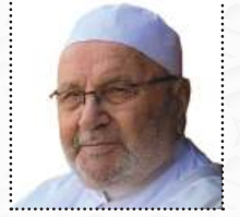
أ.د. محمد راتب النابلسي