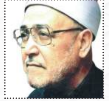
الشيخ محمد الغزالي رحمه الله

هذا الإيمان ينشئ حياة جديدة كل الجدة... ﴿أَوْ مَن كَانَ مَيِّتًا فَأَحْيَيْنَاهُ وَجَعَلْنَا لَهُ نُورًا يَمْشِي بِهِ فِي النَّاسِ كَمَن مَّثَلَهُ فِي الْظُّلْمَةِ لَيْسَ بِخَارِجٍ مِّنْهَا كَذَلِكَ زُيِّنَ لِلْكَافِرِينَ مَا كَانُوا يَعْمَلُونَ﴾ [الأنعام: ١٢٢]. فللمؤمن نوره الذي يمشي به بين الناس.