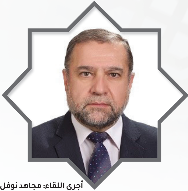
أجرى اللقاء: مجاهد نوفل