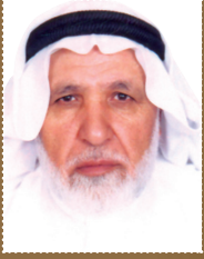
الشيخ عبدالرحمن جبريل