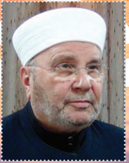
أ.د. محمد راتب النابلسي