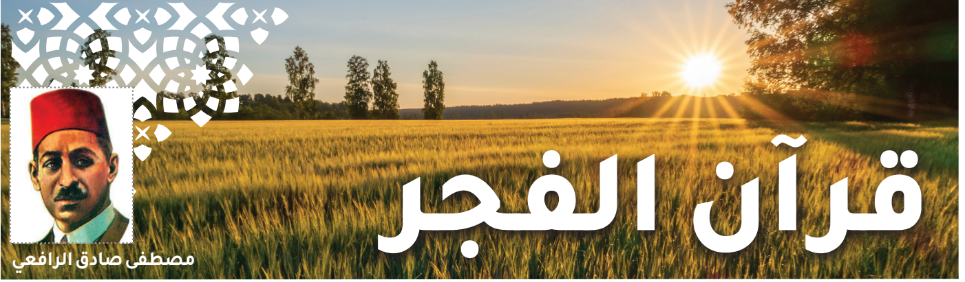
مصطفى صادق الرافعي