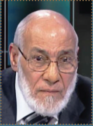
أ.د. زغلول راغب النجار