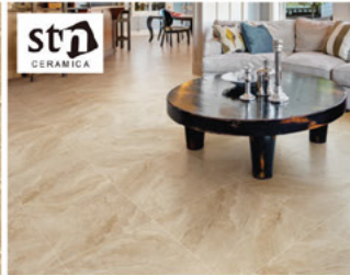
بلاط بورسلان اسباني