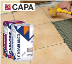
لاصق وروبة بلاط اسباني