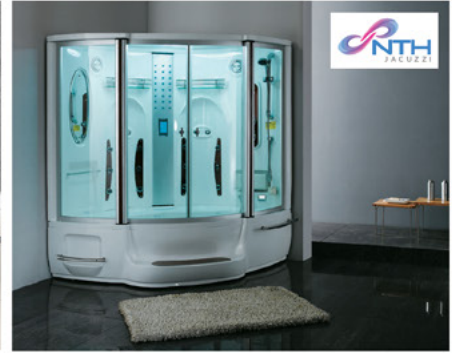
جاكوزي تركي و صيني