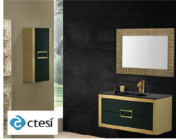
خزائن حمام برتغالي