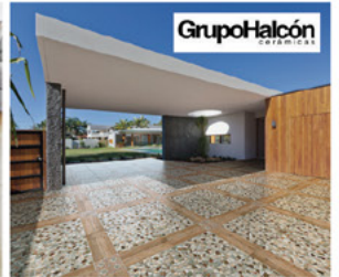
بلاط سيراميك خارجي اسباني

سيراميك - اطقم حمامات - مجالى - بطاريات - شاور بوكس - خزائن حمامات