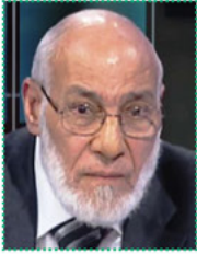
أ.د. زغلول راغب محمد النجار رئيس لجنة الإعجاز العلمي في القرآن الكريم بالمجلس الأعلى للشؤون الإسلامية - مصر