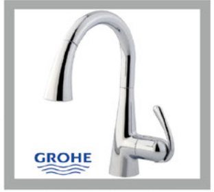
بطاريات مجلى المانية