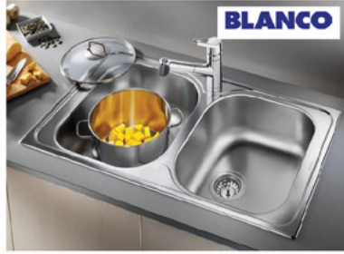
مجالى بلانكو الالمانية