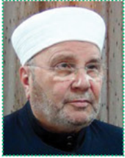
أ.د. محمد راتب النابلسي