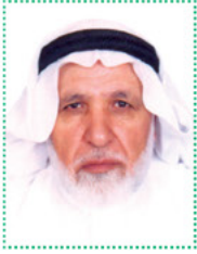
الشيخ عبدالرحمن جبريل