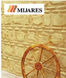
بلاط حجري اسباني