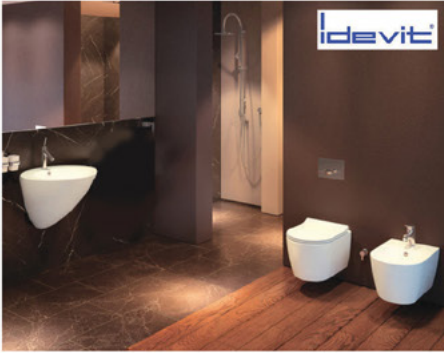
اطقم حمامات تركية