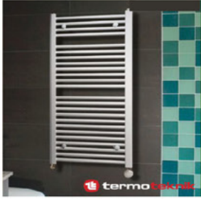
رديترات تدفئة تركية