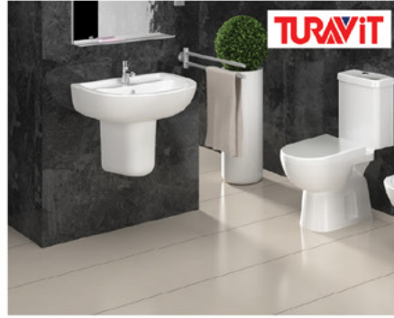
اطقم حمامات تركية