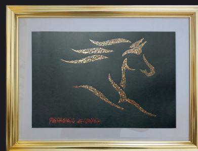
" الخيل والليل والبيداء تعرفني .. والسيف والرمح والقرطاس والقلم "