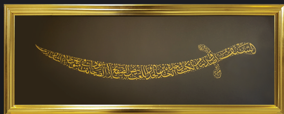
السيف أصدق أنباء من الكتب في حده المد بين الجد واللعب في متونها جلاء الشك والريب