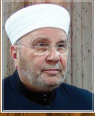
د. محمد راتب النابلسي