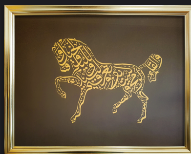
" الخيل والليل والبيداء تعرفني .. والسيف والرمح والقرطاس والقلم "