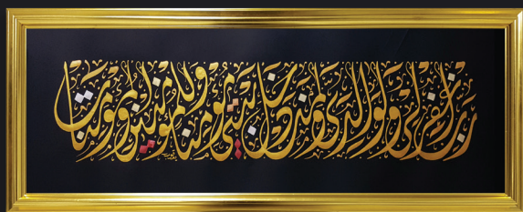
" رب اغفر لي ولوالدي ولمن دخل بيتي مؤمناً وللمؤمنين والمؤمنات "

بمناسبة حصوله على إجازة في القراءة والإقراء وسند (في التلاوة حاضراً) برواية ورش عن نافع