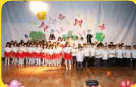
مركز الريحان/ نادي الطفل القرآني