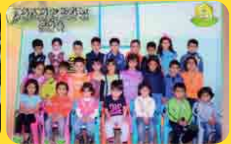
مركز أم القطين/ نادي الطفل القرآني