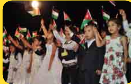
مركز ناعور/ نادي الطفل القرآني