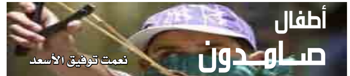
تعمت توفيق الأسعد

جودي يا ورود الأرض بحبّ الأقصى جودي.. والجنة تجود على من في حبّ الأقصى يجود.. فرضٌ وواجب علينا نفيديك.. ومن كيد الأعداء نحملك..