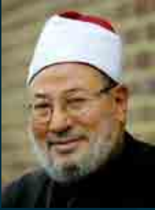
أ.د. يوسف القرضاوي رئيس الاتحاد العالمي لعلماء المسلمين

السرور، ومن الاشتغال بالخلق إلى حضرة الحق، وذلك يوجب كمال اللذة والبهجة».